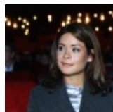
Гайдар заявила о нападении России на Грузию