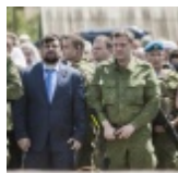
Россия может перейти к «плану Б» по Украине